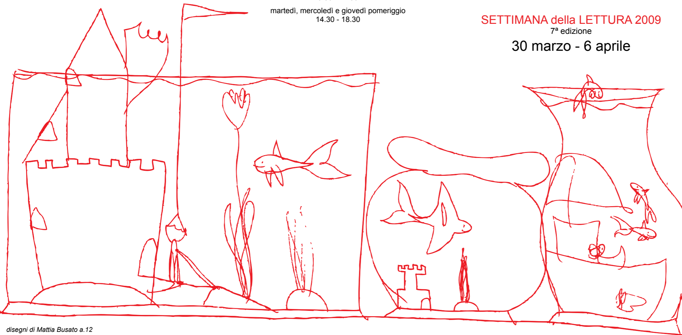
disegni di Mattia Busato a.12

La 7ª edizione della Settimana della Lettura ci invita a riflettere sull'AMBIENTE.