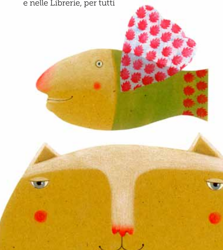
Illustrazione Arianna Papini

Città di Castelfranco Veneto Assessorato alla Cultura