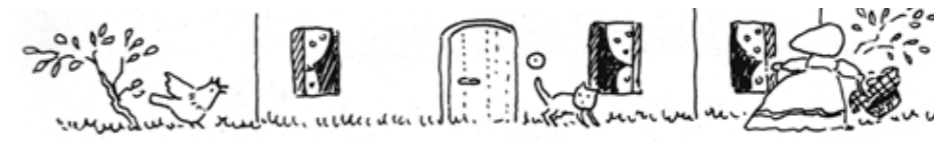
illustrazioni di Emanuela Bussolati dal libro "La ballata di Cappuccetto Rosso" di Roberto Piumini, E.Elle

in collaborazione con Biblioteca Comunale San Giorgio delle Pertiche, (PD)